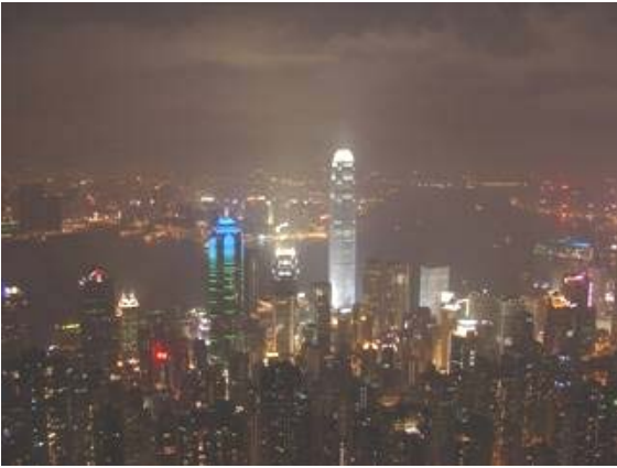
圖 1：鬧市上空的雲塊被建築物的強烈照明照光，不但造成嚴重的光害，白白散逸到宇宙去的光能更浪費了不少電力。