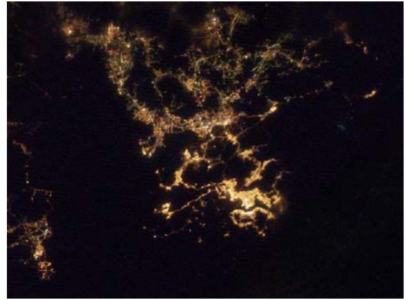
圖 2：由國際太空站拍攝的香港及鄰近珠江三角洲夜景，揭露了香港各處的夜空光度與人口的分佈有莫大關係。