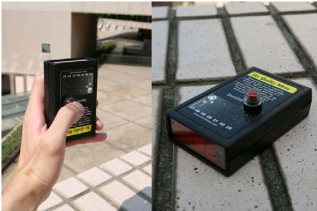
圖 3：「香港光害調查」向 200 位中學生、營地職員及天文愛好者等義工分發了 36 部圖中的「夜空光度測量錶」，在本港多處同時搜集夜空光度數據達 15 個月之久。