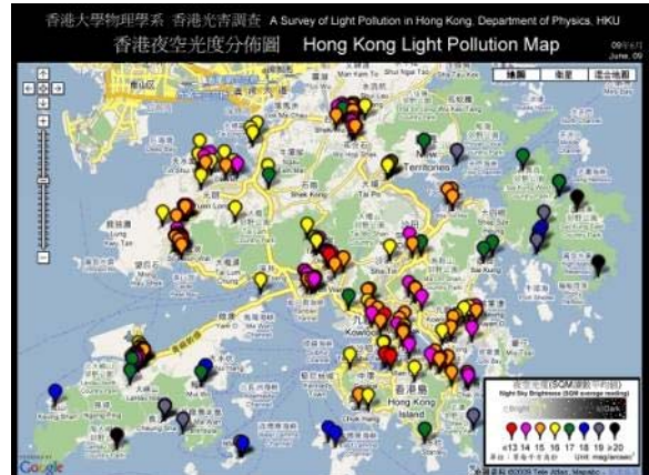
圖 4：港大將本港各地的夜空光度在Google地圖上顯示成「香港夜空光度分佈圖」。圖中黑色和紅色的標籤分別代表光害最輕及最嚴重的地方。互動網上版