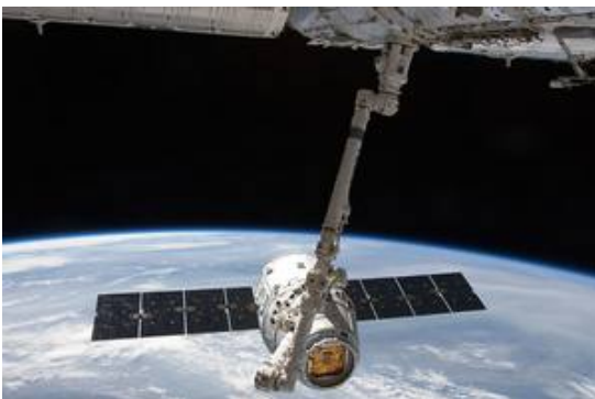
圖 1:環球太空產業在過去十年發展蓬勃，圖為 NASA 的 Space X 衛星；相片來源：NASA。